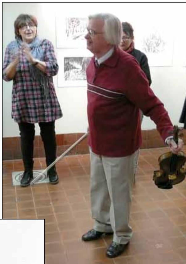
Årets Blad 2010 av Lena Wennberg

Årets Blad presenterades också för besökarna under kvällen, detta år skapat av Lena Wennberg.